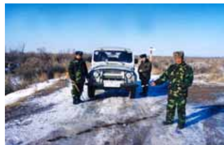
Группа инспекторов.

В рамках проекта были подписаны два соглашения. Между WWF, FZS, Империл Колледжем Лондон и Республиканским государственным предприятием "ПО Охотзоопром" Комитета лесного и охотничьего хозяйства Министерства сельского хозяйства РК, Институтом Зоологии Министерства Образования и Науки Республики Казахстан и Казахским Национальным Аграрным Университетом МОН РК. Второе соглашение - между WWF и Комитетом лесного и охотничьего хозяйства Минсельхоз РК. В соответствии с этими соглашениями осуществляется регулярный обмен информацией – и мы стремимся сделать усилия разных партнеров взаимодополняющими, и, таким образом – более эффективными. Наш проект включал техническую поддержку анти-браконьерской деятельности в ключевых сезонных местообитаниях сайгака. Мы начали работу с Андасайского заказника, который создавался для охраны основных стадий зимовки. Дальнейший мониторинг показал, что Андасай в большой степени утратил свое значение – и сайгаки зимуют теперь чаще севернее, на других территориях.