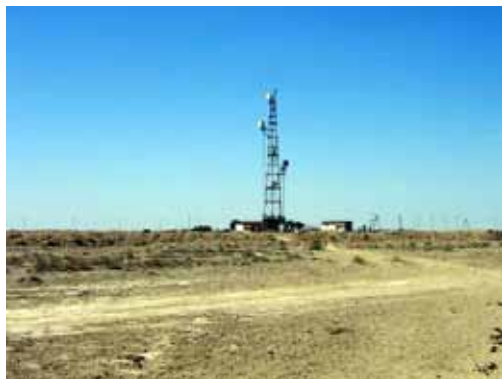
Релейная станция на восточном чинке Устюрта, Узбекистан (слева);

Сильный удар популяции сайгаков нанес человек в 1972 году, проложив железнодорожную колею Кунград-Бейнеу. Новый удар по сайгаку пришелся на 1975 год. Строители проложили трубы магистрального газопровода диаметром 1060 мм, которые легли рядом с вырытой траншеей. Трубы были сварены в ленты длиной 20-40 км. До спуска в траншею они стали препятствием на миграционном пути животных. В этот период О.П.Богданов на пути в 120 км от Урги на север он насчитал около 1000 трупов самцов. Для нынешнего поколения антилоп железная дорога не является преградой, как и автодорожная магистраль, которая пролегла через Устюрт параллельно железнодорожной. Вдоль железной дороги Кунград-Бейнеу построены станции, вокруг которых разрослись поселки. Браконьеры из них охотятся все дни в году.