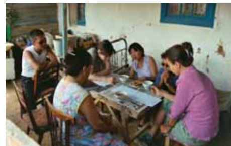
Интервьюирование семьи в поселке Таван Гашун, Калмыкия.

К настоящему времени мы сделали социальные оценки в двух поселках Калмыкии и двух поселках в Бетпак-дале. В этом году мы проделаем подобную работу на Устюрте. Так же продолжается программа по мониторингу охота в Калмыкии и на Устюрте. Результаты будут опубликованы в конце года. Дополнительную информацию можно получить, сделав запрос по адресу: e.j.milner-gulland@imperial.ac.uk