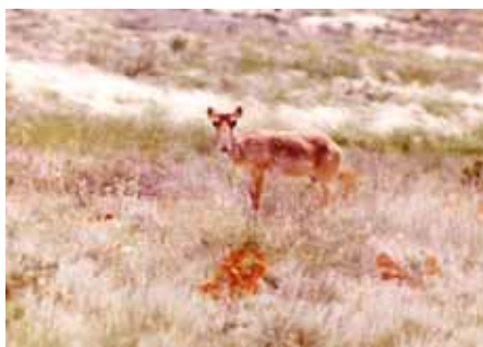
Сайгак летом.

Проект проводится при финансовой поддержке Франкфуртского Зоологического общества (FZS) и осуществляется Центрально-Азиатской программой Всемирного Фонда дикой природы (WWF). Основной целью проекта, начавшегося летом 2003 года, является: остановить катастрофическое снижение численности Бетпақдалинской популяции и добиться позитивных тенденций популяционной динамики. Задача проекта - Сохранение и восстановление популяции сайгака в Казахстане с перспективой устойчивого использования в дальнейшем. Проект включает срочные меры по прекращению браконьерства на сайгака – в первую очередь – в ключевых местообитаниях, популяционный мониторинг, анализ сезонного распределения, миграционных путей и т.д. – как основы для реализации практических мер по его сохранению.