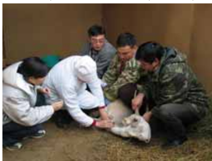
Взятие образца крови у выращенного в неволе самца сайгака.