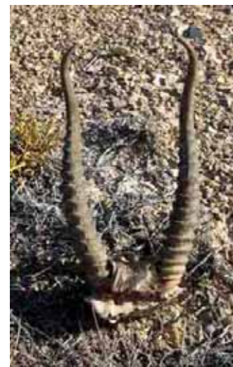
Рога сайгака, вырубленные с фрагментом черепа.

Однако, большинство прошлых исследований ограничивалось проведением компонентного анализа и сравнением полученных результатов при отсутствии широких клинических испытаний заменителей. Тем временем, люди, использующие препараты TCM, мало знают об угрожаемом состоянии дикой популяции сайгака. Поэтому применение заменителей до сих пор не получило широкого распространения