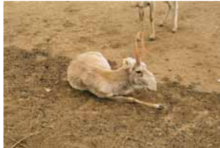
Самцы сайгака: а) Номинативный подвид S.t.tatarica в Центре диких животных РК. б) Монгольский сайгак.

Существует так же проблема генетических различий четырех популяций номинативного подвида. Поскольку численность Бетпакалинской популяции достигла критически низких величин, является ли жизненно необходимым срочное вмешательство для предотвращения потери генетического разнообразия в случае утраты этой популяции? Или необходимо ограничить фондирование, направив его на поддержание популяций, имеющих больший шанс на выживание, если Бетпакалинская популяция не является генетически отличной? Каковы последствия смешанного происхождения выращенных в неволе стад и межпопуляционного обмена? Проект, финансируемый INTAS, поставил перед собой задачу получить ответы на эти вопросы.